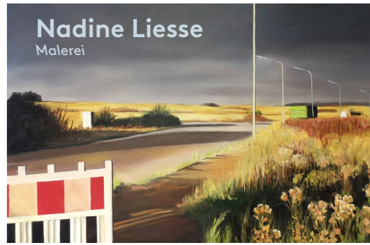
Nadine Liesse Malerei