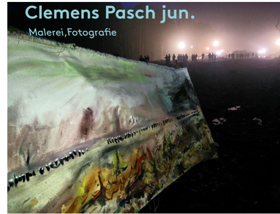
Clemens Pasch jun. Malerei, Fotografie